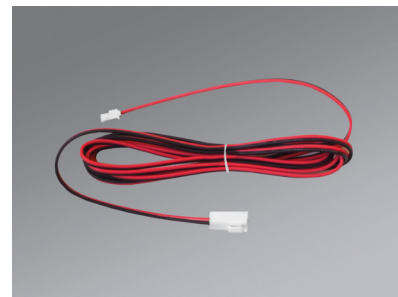
Verlängerungsleitung Niedervolt IP20, Länge 2.000 mm (MGL 0016)