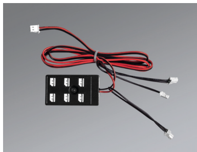
Multikonnenktor 6-fach Niedervolt IP20, Länge 1.000 mm (MGL 0015)